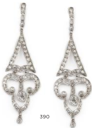
390 Pendientes largos de brillantes estilo Belle époque con trébol que pende de triángulo y lágrima, y dos chatones de brillantes colgantes en la parte inferior

En montura de platino. Peso total aprox btes: 3,7 ct Longitud: 6,2 cm